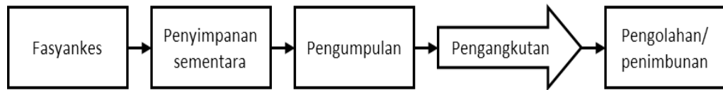
Gambar 2 Alur Pengelolaan Limbah Medis Fasilitas Pelayanan Kesehatan Berbasis Wilayah